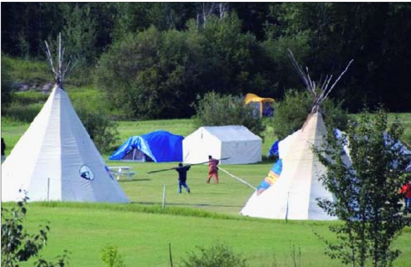
Photo: Holy Angels Residential School Reunion, Fort Chipewyan, August 2007

Au cours de la récente période, le personnel de la Fondation autochtone de guérison a assisté à la réunion des anciens élèves de Holy Angels Indian Residential School à Fort Chipewyan, Alberta. Les membres du personnel de la Fondation autochtone de l'espoir qui ont enregistré pendant plus de deux ans les histoires d'anciens élèves des pensionnats dans le cadre d'un projet éducatif conçu pour informer les jeunes et le public en général sur les séquelles laissées par les pensionnats y ont également participé. Les photos présentées au-dessus et en-dessous ont été prises pendant cette rencontre en août 2007.